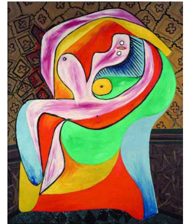
Pablo Picasso - Le repos - 1932