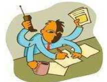
« L'Homme de Vitruve ou le surmenage » version Le Crédit Lyonnais 2009