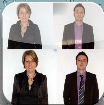
LCL travaille comme tu es !