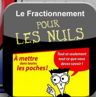
Fractionnement pour les nuls