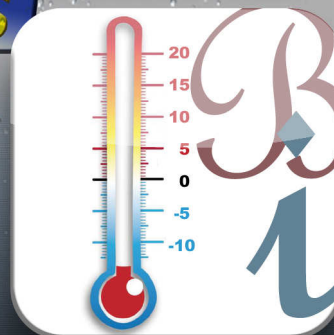
LCL : Bilan inefficacité ?