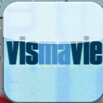
Vis ma vie chez FO