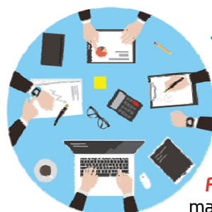
Table ronde sur les conditions de travail

En mars, FO LCL alertait la direction sur le fait qu'elle assujettissait à tort les sommes provenant du CET aux cotisations « complémentaire incapacité invalidité décès » (prévoyance). Cette erreur était d'ailleurs encore plus préjudiciable à LCL qu'aux salariés, puisque la cotisation est supportée à 70% par LCL. La direction nous a informés qu'elle avait modifié le système de paie pour rectifier cette erreur. Grâce à FO LCL , vous pouvez donc tranquillement transférer des jours de CET vers le PERCO lors de la campagne de ce mois.